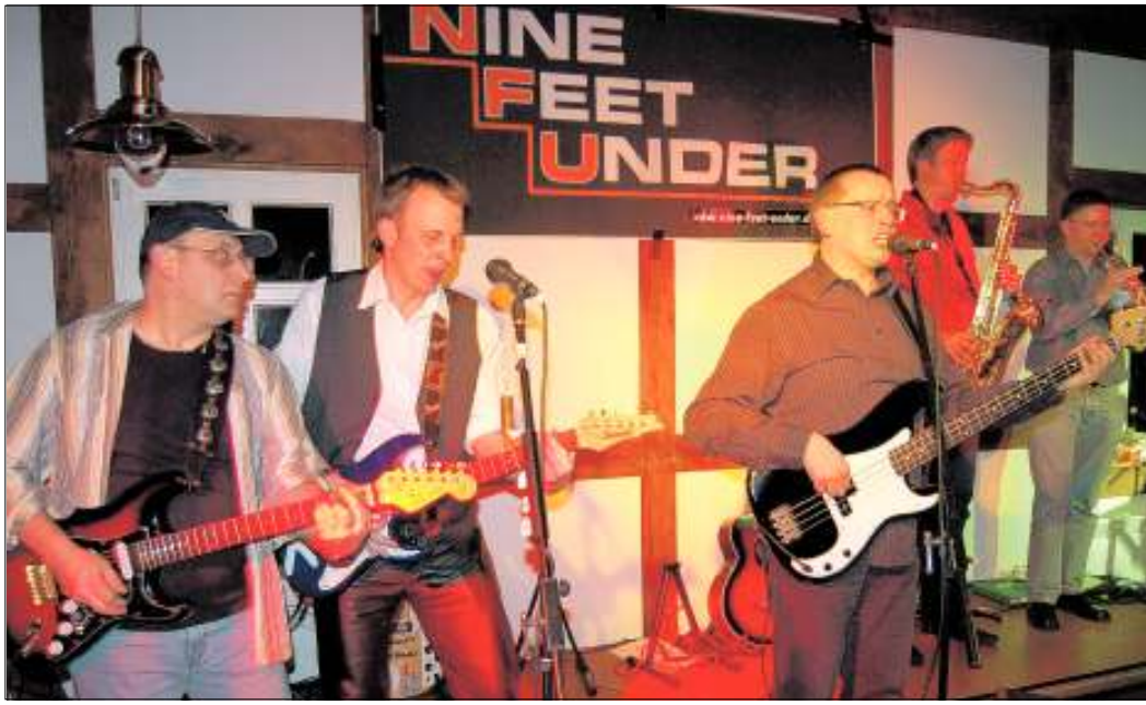
Ließ den Funken überspringen: Die Band „Nine Feet Under“.

Vor vollem Haus treten anschließend die Musiker von „Nine Feet Under“ vor ihr Publikum. Schon 2008 hatten sie das Rockkonzert gegeben – und seinerzeit für mächtig Begeisterung gesorgt. „Für uns stand schnell fest, dass wir sie wieder einladen“, sagt Siemon. Dass sich die Verpflichtung